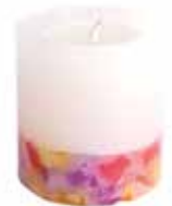
in0-30-364 Stumpenkerze Paraffin, weiß/multicolor, 5,8 x 6,5 cm 4,90 €