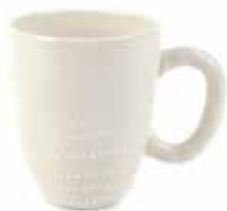
tl5-20-360 Kaffebecher „Nature“ Keramik, off-white, Ø 8 cm, H 10,5 cm 11,90 €