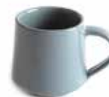
ne6-20-423 Teebecher „Patan“ Keramik, taubenblau, H 7,5 cm 10,90 €