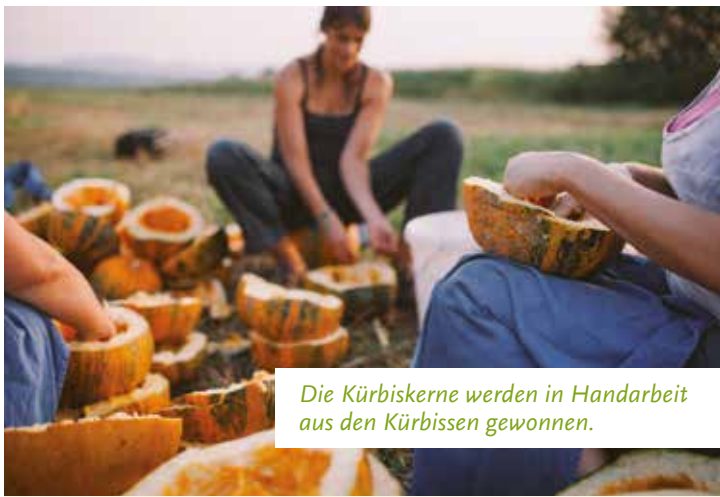
Die Kürbiskerne werden in Handarbeit aus den Kürbissen gewonnen.