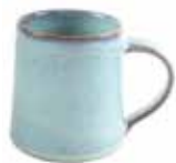
ne6-20-412 Teebecher „Patan“ Keramik, türkis, H 8,5 cm 10,90 €