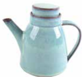
ne6-20-410 Teekanne „Patan“ Keramik, türkis, 7,5 x 17 cm, 1 Liter 34,90 €