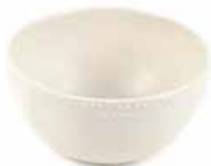
tl5-20-362 Schale „Nature“ Keramik, off-white, 18 x 7,5 cm 15,90 €

geeignet für Mikrowelle und Spülmaschine