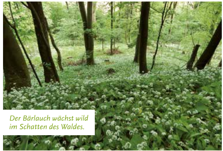
Der Bärlauch wächst wild im Schatten des Waldes.

Für die Landwirtschaft kann in Slowenien aufgrund der vielen Berge und ungünstiger Niederschläge nur etwa ein Viertel der Fläche genutzt werden. Angebaut wird hauptsächlich Mais, Weizen, Gerste und Kartoffeln, aber auch Weinberge sowie Obst- und Olivengärten finden sich in Slowenien. Im Jahr 2014 waren 94 % der agrarischen Nutzfläche in privatem Besitz mit einer durchschnittlichen Betriebsgröße von 6,6 ha. Zu Zeiten des kommunistischen Systems in Jugoslawien gab es viele kleine Familien-Farmen, die alle 10 ha besaßen. Auf denen bauten sie vor allem Mais und Weizen an. Deshalb sind noch heute viele Familien in Besitz von Land.