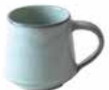
ne6-20-413 Teebecher „Patan“ Keramik, türkis, H 7,5 cm 10,90 €

geeignet für Mikrowelle und Spülmaschine