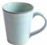
ne6-20-411 Kaffeebecher „Patan“ Keramik, türkis, H 10 cm 11,90 €