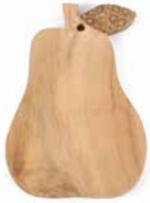
id7-20-052 Schneidebrett „Birne“ Regenbaum-Holz mit eingearbeiteten Bambusscheiben, hell, 25 x 17 cm 15,90 €