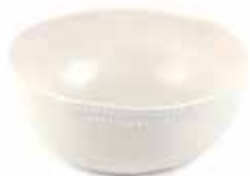
tl5-20-361 Schale „Nature“ Keramik, off-white, 13 x 6,5 cm 10,90 €