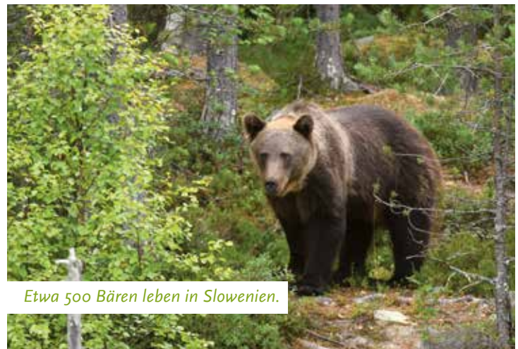
Etwa 500 Bären leben in Slowenien.