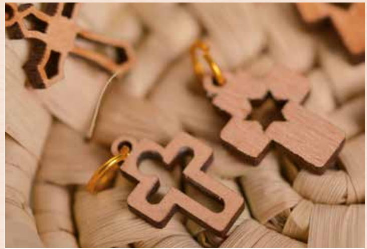
pl3-40-629 Anhänger „Kreuz“ am Baumwollband Olivenholz, L 3,5 cm 3,80 €

Der Olivenbaum gilt mit seiner knorrigen Gestalt und seinem warmen, sonnenhungrigen Holz auch als Baum der Weisheit und des Friedens.