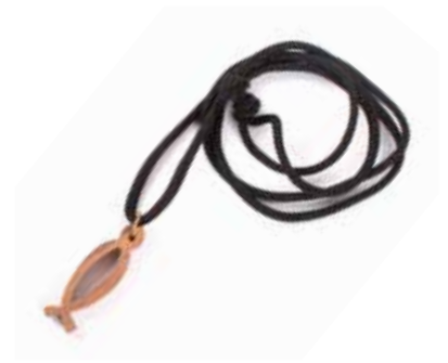
pl3-40-628 Anhänger „Fisch“ am Baumwollband Olivenholz, L 3 cm 1,90 €