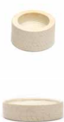
ke4-80-176 Teelichthalter aus Kisii-Speckstein „Edged“ natur, ca. H 3 cm, Ø 5,5 cm 4,90 €

Undugu aus Kenia unterstützt Kunsthandwerker bei der Vermarktung und dem Export ihrer Produkte. Undugu bietet Workshops zur Produktentwicklung und Informationsveranstaltungen zu den Themen Fairer Handel, Gesundheit und Sicherheit am Arbeitsplatz für die Produzenten an. Die Ziele der Organisation: die Arbeitsbedingungen vor Ort verbessern, soziale Programme fördern und Bildungsmöglichkeiten ausbauen. Etwa 300 Produzenten fertigen in aufwändiger Handarbeit die Kunstwerke aus Speckstein.