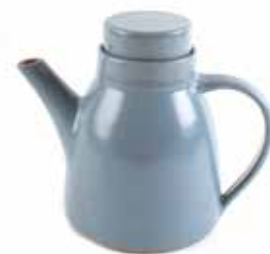
ne6-20-420 Teekanne „Patan“ Keramik, taubenblau, 7,5 x 17 cm, 1 Liter 34,90 €