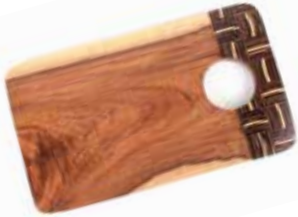
id7-20-065 Schneidebrett Regenbaum-Holz mit eingearbeiteter Kokosnussschale, 35 x 20,5 cm 22,90 €