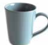
ne6-20-421 Kaffeebecher „Patan“ Keramik, taubenblau, H 10 cm 11,90 €