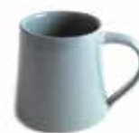
ne6-20-422 Teebecher „Patan“ Keramik, taubenblau, H 8,5 cm 10,90 €