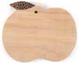
id7-20-053 Schneidebrett „Apfel“ Regenbaum-Holz mit eingearbeiteten Bambusscheiben, dunkel, 23 x 19 cm 15,90 €